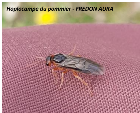
Hoplocampe du pommier - FREDON AURA

Analyse de risque : La période de ponte est en cours. Les températures annoncées cette semaine ne favoriseront pas une forte activité de pontes dans les parcelles encore en fleurs. Le risque sera modéré.